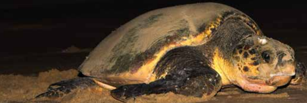
Tortuga marina (Caretta Caretta)